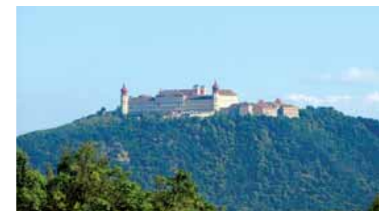
Von Götting nach Melk – die beiden berühmten Benediktinerstifte sind Anfang und Ende unseres Jakobswegs.