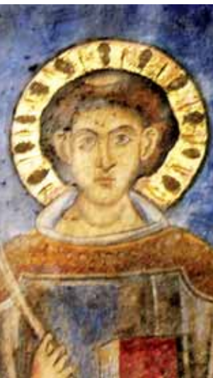
Ein Fresko des Heiligen Jakob, der zu den ersten Jüngern Jesu zählte.

Der Jakobsweg in Spanien zählt zu den bekanntesten Pilgerstraßen der Welt. Aber auch in Niederösterreich kann man auf den Spuren des Apostels wandern.